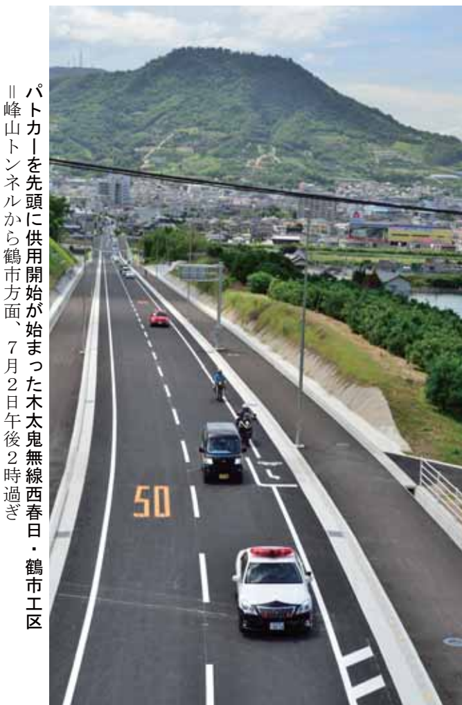
パトカーを先頭に供用開始が始まった木太鬼無線西春日・鶴市工区 峰山トンネルから鶴市方面、7月2日午後2時過ぎ