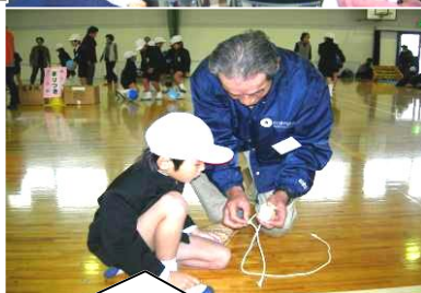
世代間交流(弦打小学校1・2年生と老人クラブ連合会)ふるさと学習12月