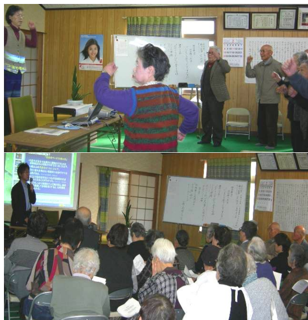
(写真:上はうどん体操,下は講演会の様子)

高齢者の身体特性やリハビリ介護等のわかりやすい話を聴き、高齢者にとっても介護する側にとっても今後の生活に役立つ内容でした。