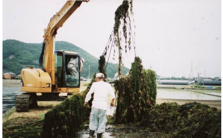
▲友常池 清掃作業 ▼飯田町クリーン作戦