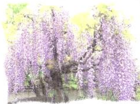
写真：岩田神社孔雀藤

また夜はライトアップにより、昼間とは違った藤を楽しむことができます。長く房を垂れ重なりあつて開いた藤は紫色の煙る雨のようにも見え、見る人を引き込む幻想的な美しさを持っています。ぜひ一度お越しください。（弦打観光協会）