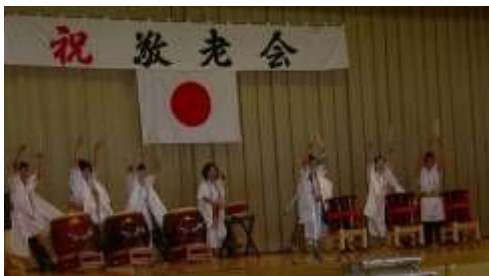
▲和太鼓集団「雅美」によるエネルギーギッシュな演奏