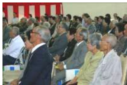
▲敬老会員の方は椅子席なので足も痛くなりません。