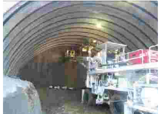
写真 木太鬼無線トンネル工事の様子

地域住民の皆様方には当協議会へのますますのご支援、ご協力を心からお願い申しあげ、新年のあいさつといたします。