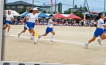
7.徒競走(小学4・6年生)