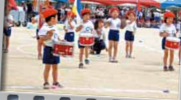
6.ゆめがいっぱい ~つるうちゅパレード~(保育所)