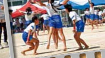
23.137億年の物語 ~輝く未来へ向かって~(小学6年生)