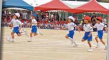
4.徒競走(小学1・2年生)