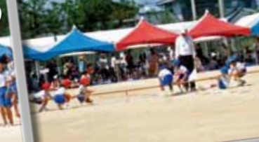
22.つな引き(小学3年生)