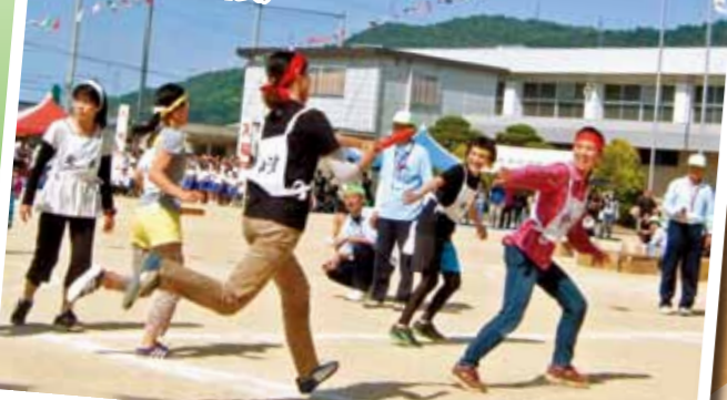
27.自治会対抗リレー (小学生・一般男女)