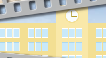
13.元気いっぱい、ほくたちの お米づくり(小学3年生)