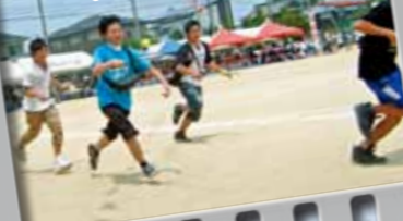
15.スプーン競走 (中学生以上自由参加)