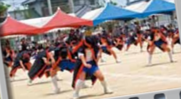
14.水の旅-弦打ソーラン節- (小学4年生)