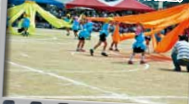
8.えがおの花がひ~らいた (幼稚園)