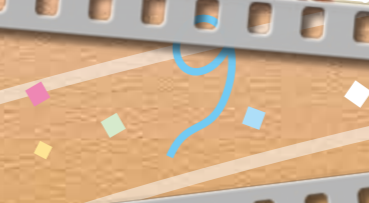
18.源平合戦 ~2014弦打の陣~(小学5・6年生)