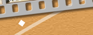
24.障害物競走 (中学生以上自由参加)