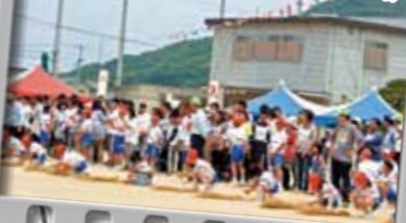
17.縄ない競走 (小学生・一般男女)