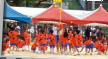
9.てんとおむ☆し♪ にこにこ玉入れ(幼稚園)