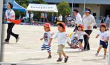
3.かけっこ(保育園・幼稚園)