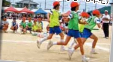
16.学級対抗リレー (小学3~6年生)