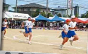
5.徒競走(小学3・5年生)