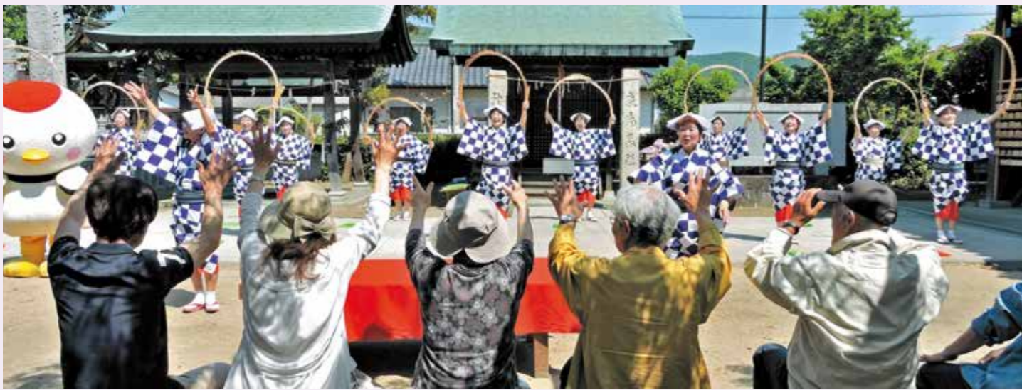
今年もやってきた大江戸玉すだれ岡山社中

弦打校区の人口(平成30年6月1日現在) 合計10,760人 男5,283人 女5,477人 世帯5,155世帯