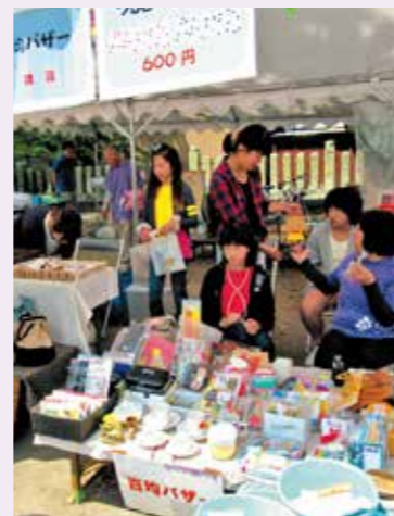
ゆめづくりコーナー