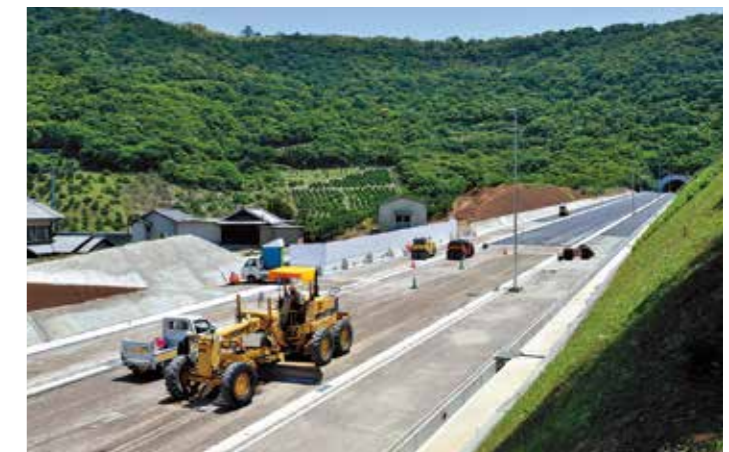
峰山トンネルを抜け、御殿貯水池の南を通る