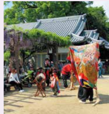
青木獅子組の獅子舞

岩田神社の藤まつりが、4月21日～5月3日までの13日間に行われました。境内には、樹齢800年ともいわれる孔雀藤(くじやくふじ)が見事に咲き誇り、その色と香りに参拝の人々も酔いしれている様子で