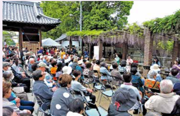
姐姐四の二胡コンサート