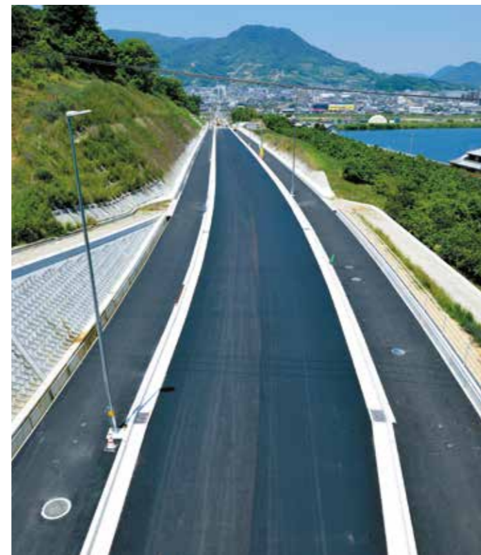
峰山トンネルから鶴市、鬼無町に延びる鶴市工区

この市道の完成により、弦打地区が市中心部と東西の幹線道路で結ばれ、県道176号郷東町交差点付近の朝夕の渋滞緩和が期待されます。