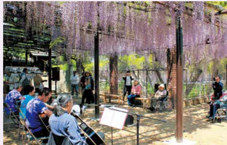
「ゆめづくり」の藤棚コンサート