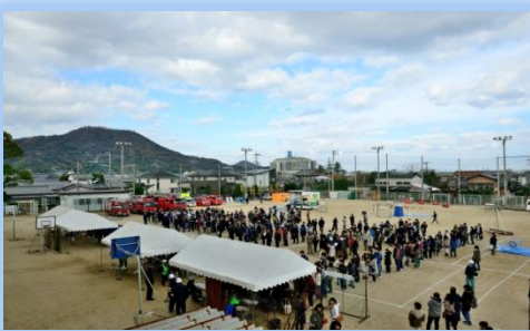
訓練参加者の状況です。

平成27年12月5日(土)午前8時45分、震度6強の南海トラフ地震が発生し、市内の多数の家屋が倒壊、また火災も発生し大津波警報が発令されたという想定で、自主防災訓練が行われました。1,000人を超える参加者はより一層防災意識を高めたことと思います。