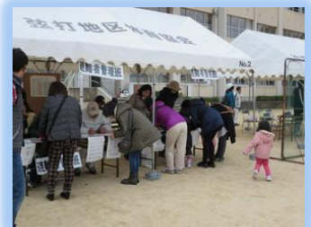
到着した順に、受け入れを開始しました。