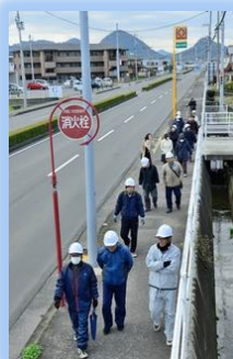
自治会などが揃って弦打小学校へ避難。