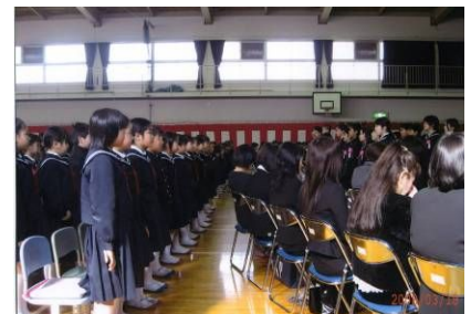
写真:18日(火)弦打小学校 卒業式