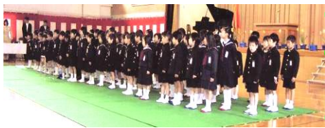
(取材・写真:総務広報部会M.K)

弦打保育所 4月 7日 16名入所 弦打小学校 4月10日 94名入学 弦打幼稚園 4月11日 34名入園 新しい生活がスタートしました。 地域の皆様の温かい目で、登下校時などに子どもたちを見守ってください。