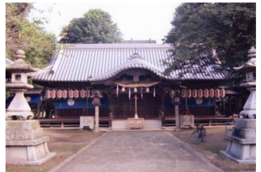
写真:岩田神社境内・孔雀藤