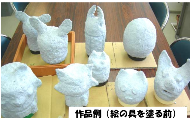
作品例 (絵の具を塗る前)

再生紙をミキサーにかけ, パルプ状態にし, 水を切り, パイプとボンドを混ぜ紙粘土状にします。蓋(ふた)つきのプラスチック容器を反対にし, お金を入れる穴を熱で溶かして開け, ペットボトルにボンドをつけた新聞紙を貼り輪郭を作り, その上に紙粘土状のパルプを貼り付け形を整えます。