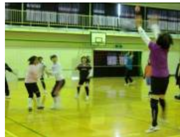
写真:1月30日バレーボール大会と2月13日インディアカ大会の様子。(弦打小学校体育館)