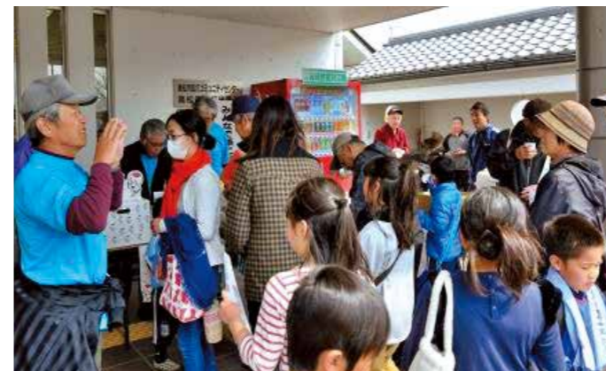
ウォーキングを終えてクイズに正解するとバッジが貰えました。