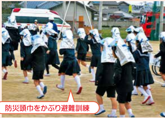
防災頭巾をかぶり避難訓練