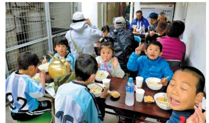
うどんとおはぎのお接待 (体育協会のボランティアの皆さんが用意して下さいました。)